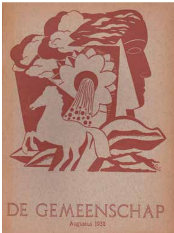
Leo Gestel, omslag De Gemeenschap , 1938.