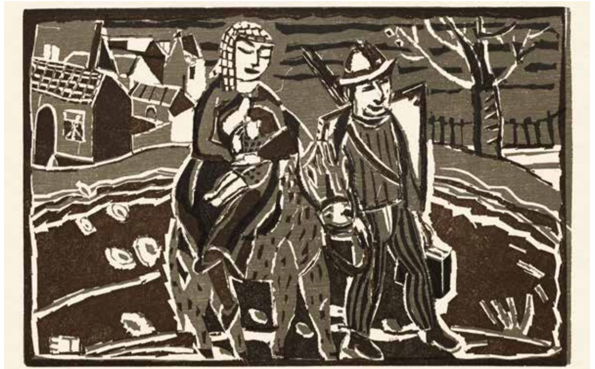
Edgar Tytgat, De vlucht naar Egypte .